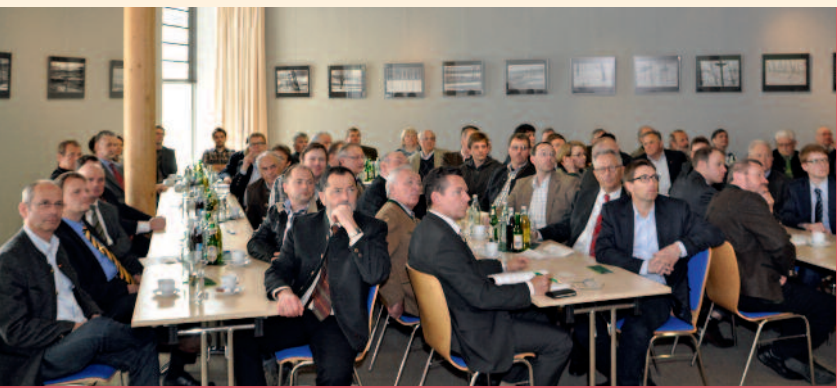
Mitgliederversammlung der Gesellschaft für Hopfenforschung in Wolnzach

In his opinion, great hope can also be set on the trend towards significantly increased hopping by the craft brewers in the USA who are now conquering Asia and Europe with their specialty beers. To this end the Society of Hop Research has come up with four new varieties – Polaris, Mandarina Bavaria, Huell Melon and Hallertau Blanc – which will be available to the German hop growers through license agreements in 2012.